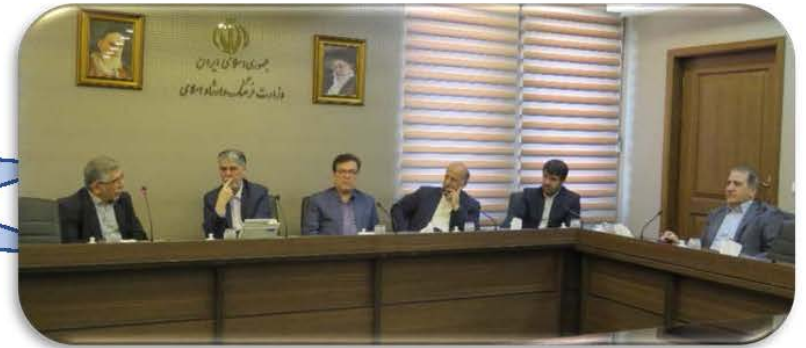
دیدار رییس پارک در نشست با مدیران شرکت‌ها