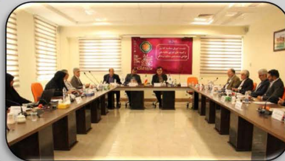
نشست شورای سیاستگذاری و کمیته‌های اجرایی جایزه ملی طراحی بسته‌بندی صنایع فرهنگی