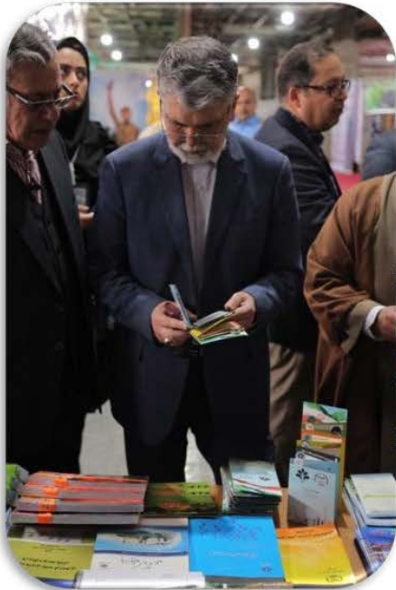
بازدید وزیر فرهنگ از غرفه پارک ملی علوم و فناوری‌های نرم و صنایع فرهنگی در محل برگزاری نمایشگاه کتاب