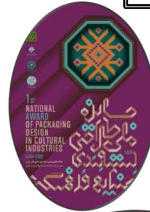
رونمایی از پوستر و سایت جایزه ملی طراحی بسته بندی در صنایع فرهنگی با مسئولین عالی رتبه کشوری