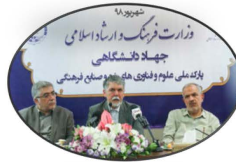
انعقاد قرارداد پارک و وزارت فرهنگ و ارشاد اسلامی به ارزش ریالی ۵ میلیارد