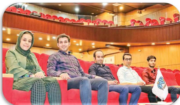
شرکت سیمرغ زرین هنر (پلاتو)