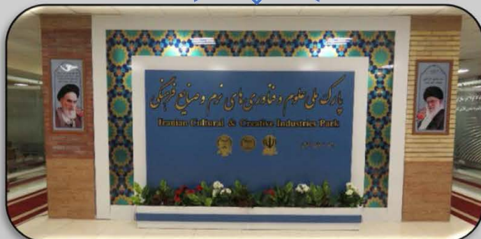
افتتاحیه پارک ملی علوم و فناوری‌های نرم و صنایع فرهنگی واحد استان زنجان