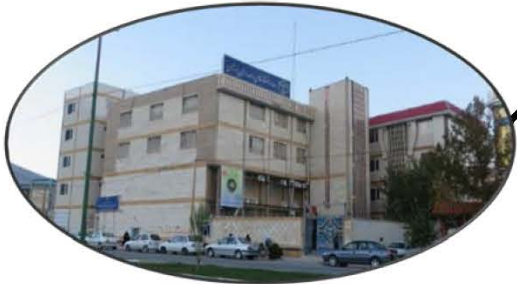
پیگیری راهاندازی واحد استان لرستان