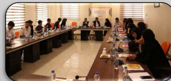
نخستین نشست کمیته دانشگاهی جایزه ملی طراحی بسته‌بندی صنایع فرهنگی