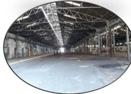
بازدید از کارخانه سدید جهت استفاده از پتانسیل کارگاهی این مجموعه جهت شرکتها و تیمها