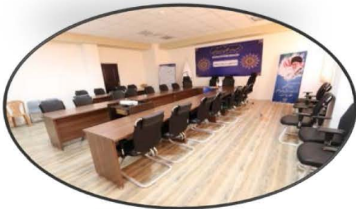
پیگیری راهاندازی واحد استان مرکزی