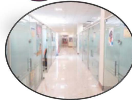
ایجاد مرکز رشد به منظور ایجاد زمینه کار آفرینی و جذب دانش آموختگان دانشگاهی