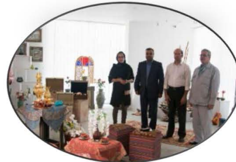
بازدید از مجموعه صنایع دستی آپادانا از شرکت‌های مستقر در پارک به همراه شرکت سرمایه‌گذار