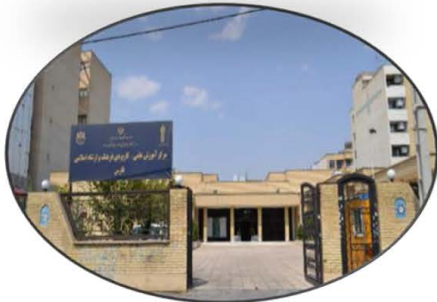
پیگیری راهاندازی واحد استان فارس