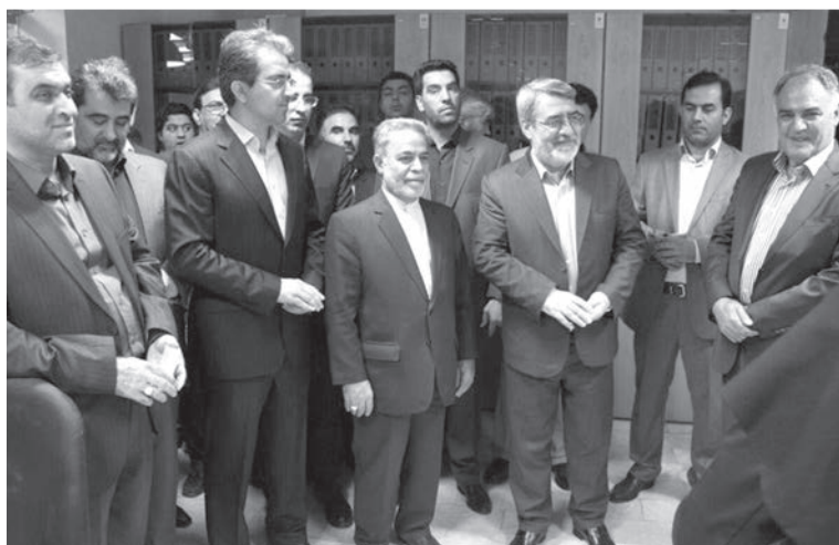
بازدید وزیر کشور از شرکت الکتروکویر یزد