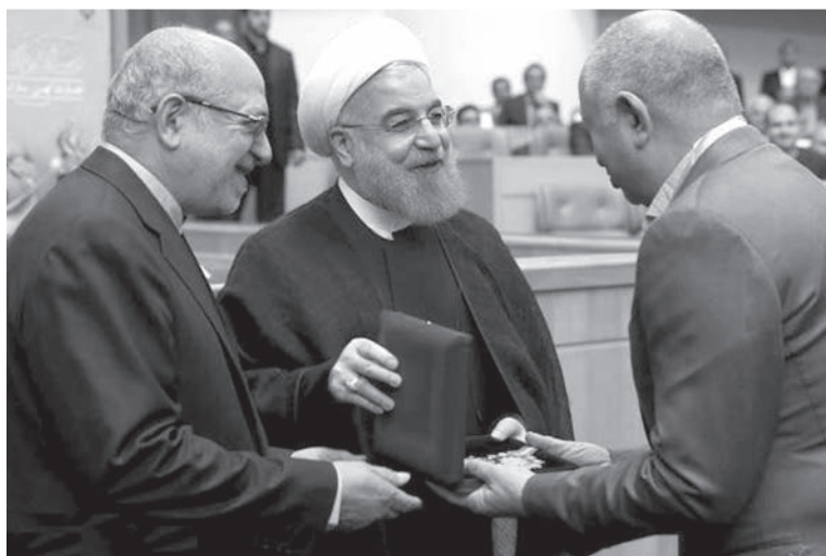
مدال افتخار ملی صادرات