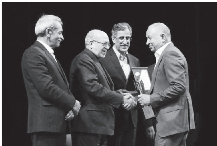
دریافت تندیس و نشان امین‌الضرب