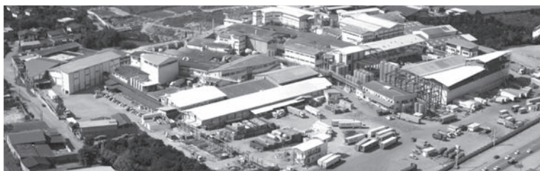
کارخانه کاله، آمل