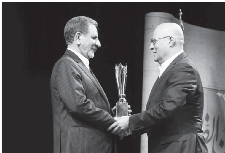
دریافت تندیس و نشان امین‌الضرب