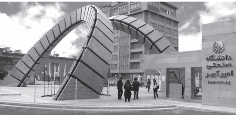
دانشگاه پلی تکنیک