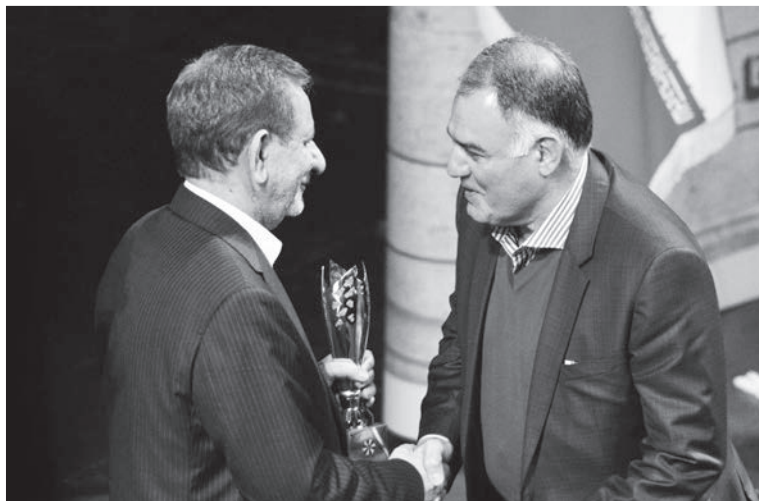
دریافت تندیس و نشان امین‌الضرب